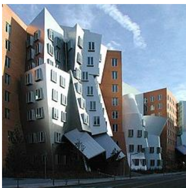
Frank Gehry Centro "Stata" Cambridge - Instituto de Tecnología de Massachusetts EEUU 2004

El término apareció por primera vez en la década de 1980, como una idea desarrollada por el filósofo francés Jacques Derrida. Derrida, un amigo de Peter Eisenman, desarrolló la idea de fragmentar un edificio y explorar la asimetría de la geometría (inspirada en el constructivismo ruso), manteniendo la funcionalidad central del espacio (inspirada en el modernismo).