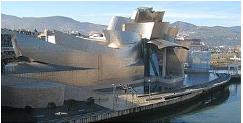
Frank Gehry Museo Guggenheim de Bilbao España 1992/97