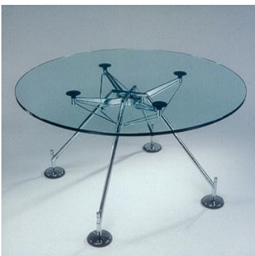
Norman Foster serie "Nomos" Mesas y asientos en tándem 1987

La arquitectura de alta tecnología (High Tech), también conocido como modernismo tardío o el expresionismo estructural, es un estilo arquitectónico que surgió en la década de 1970, la incorporación de elementos de la industria de alta tecnología y la tecnología en el diseño de edificios. La arquitectura de alta tecnología renovada apareció como el modernismo, una extensión de esas ideas anteriores ayudado por los avances tecnológicos aún más. Esta categoría sirve como un puente entre el modernismo y el posmodernismo. Sin embargo, aún existen zonas grises en cuanto a dónde termina una categoría y empieza el otro. En la década de 1980, la arquitectura de alta tecnología se hizo más difícil de distinguir de la arquitectura postmoderna.