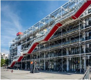
Renzo Piano y Richard Rogers "Centro Nacional de Arte y Cultura Georges Pompidou" París - Francia 1971/77