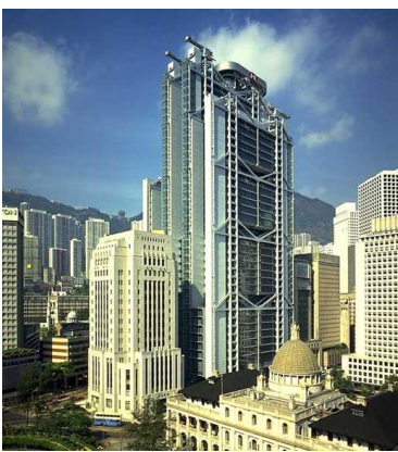
Norman Foster "Banco Nacional de Hong Kong" 1979-85