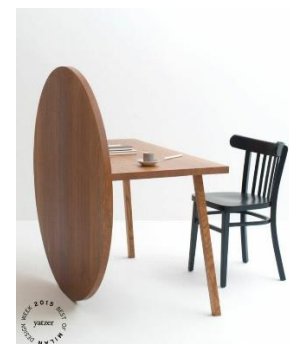
Muebles de impronta Deconstructivista