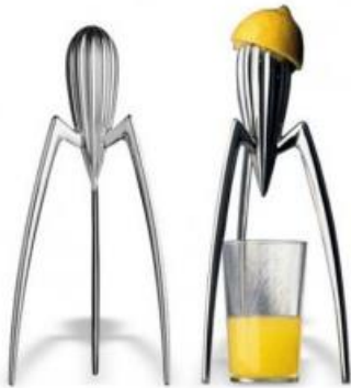
Philippe Starck exprimidor "Juicy Salif" para Alessi 1991

A partir de la década de los '80, surgen otras propuestas que muchos autores las engloban en el Posmodernismo, ya que comparten algunas de sus características. Es el caso del Minimalismo, el Deconstructivismo y el High Tech, entre otras.