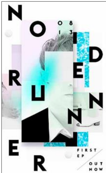
Gráfica posmoderna con influencia deconstructivista.