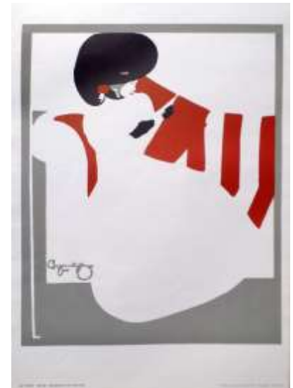
Los Beggarstaffs seudónimo de los artistas William Nicholson y James Pryde Mujer en el sofá de 1895, se puede apreciar líneas del Art Nouveau, pero con una extrema simplificación.