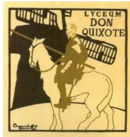
Los Beggarstaffs seudónimo de los artistas William Nicholson y James Pryde , precedió al Plakatstil en varios años. Trabajaban principalmente con collages y papel cortado y tuvo escaso éxito comercial en su momento, pero sus obras, incluido este cartel de 1895. Lyceum Don Quixote, se consideran ahora muy influyentes.