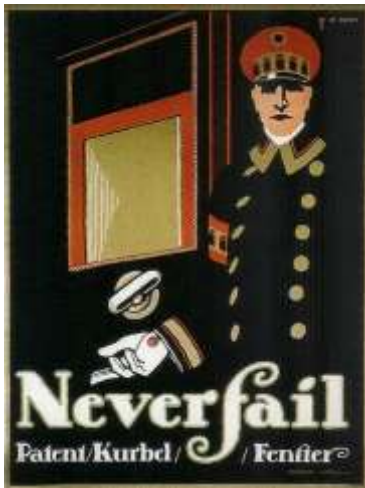
Hans Rudi Erdt ejecutado en el estilo Plakatstil para la empresa de seguridad Never Fail – 1911