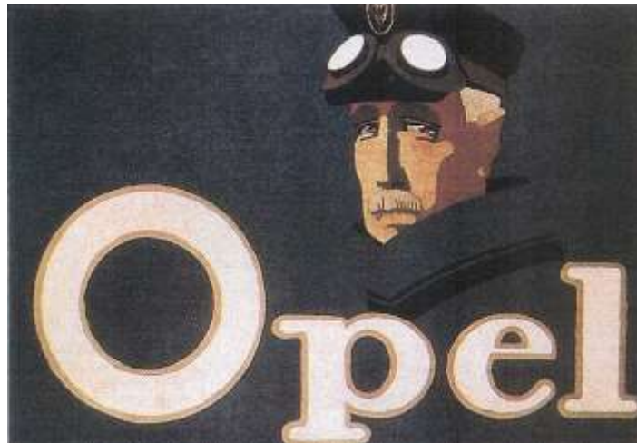
Hans Rudi Erdt Cartel para los automóviles Opel, 1911. La pose, la expresión y el vestuario simbolizan la prosperidad del cliente de este automóvil.