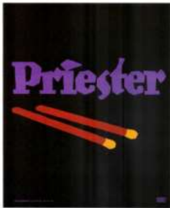
El famoso cartel diseñado por Bernhard en 1905 para los fósforos Priester. La simplicidad de la ejecución acreditó el nacimiento del estilo Plakatstil en Alemania.

La primera contribución de Lucian Bernhard al diseño gráfico fue el ser uno de los primeros artistas comerciales que rechazaron la hegemonía ornamental del art nouveau durante la década de 1900. Nació en Stuttgart en 1883.