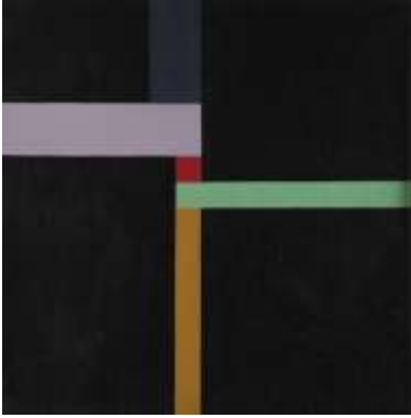
Max Bill "Cuadrado a partir de nueve rectángulos" – 1945