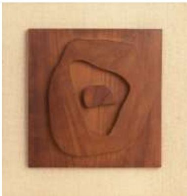
Jean Arp "Formas" madera de cerezo montada sobre tabla – 1945

Este movimiento surge en Francia en 1930 de la mano del pintor holandés Theo van Doesburg quién creó el término de "arte concreto" para sustituir al de arte abstracto, por lo que también es conocido como arte constructivo-abstracto o concretismo. El término fue utilizado por primera vez por Van Doesburg en el "Manifiesto del arte concreto" publicado en el primer y único número de la revista "Art Concret" editada en París, en respuesta a la formación de la asociación "Cercle et Carré" (Círculo y Cuadrado). Su eslogan fue "materiales reales, espacio real".