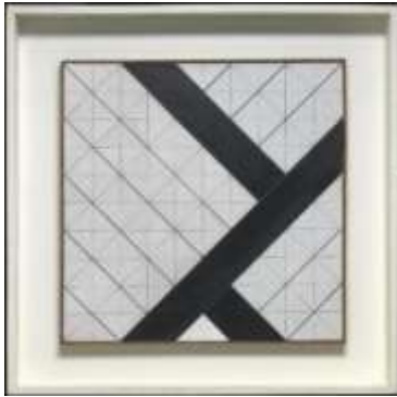
Theo van Doesburg