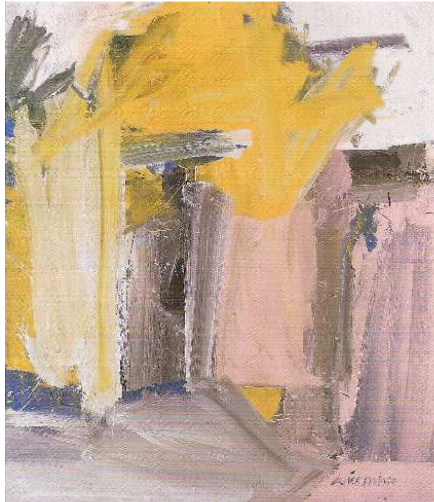
Willem de Kooning. Door to the River , óleo sobre lienzo, 1960.