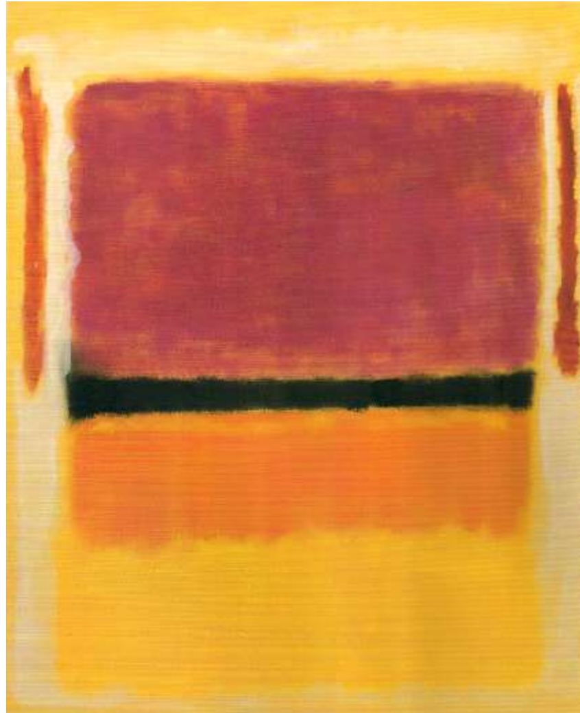
Mark Rothko. Sin título (violeta, negro, naranja, amarillo sobre blanco y rojo), óleo sobre lienzo, 207 x 167,5 cm., 1949.

Pintura de contemplación o de campos de color. All over (de un borde al otro).