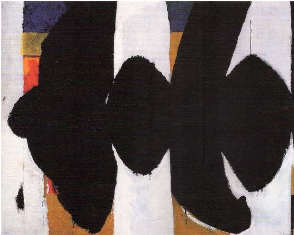
Robert Motherwell. Elegy to the Spanish Republic N° 34 , óleo sobre lienzo, 1953/54.