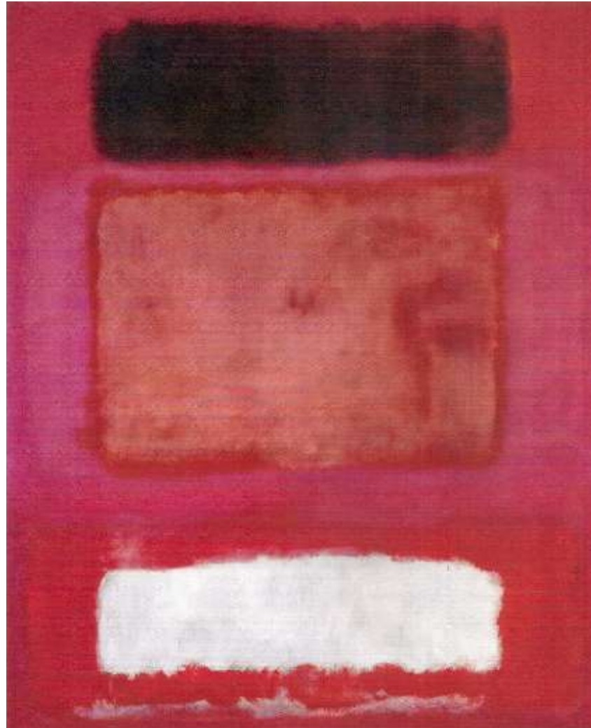
Mark Rothko. Red, White and Brown , óleo sobre lienzo, 1957.

Pintura de contemplación o de campos de color. All over (de un borde al otro).