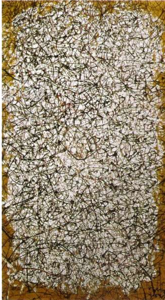
Mark Tobey. Sin título, aguada sobre papel, 34,5 x 19,5 cm., 1959.

Escuela del Pacífico. Pintura caligráfica.