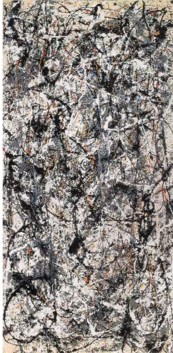
Jackson Pollock. Catedral , esmalte y pintura de aluminio, 1947.