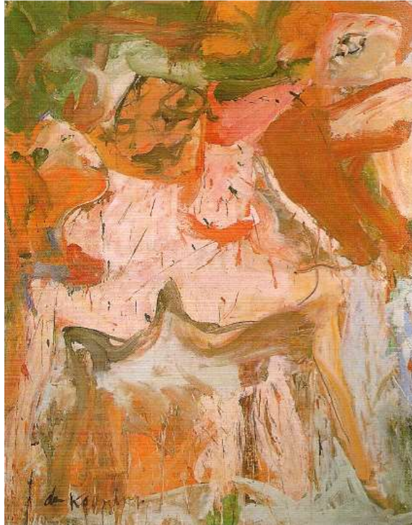
Willem de Kooning. La visita , óleo sobre lienzo, 1966-1967.