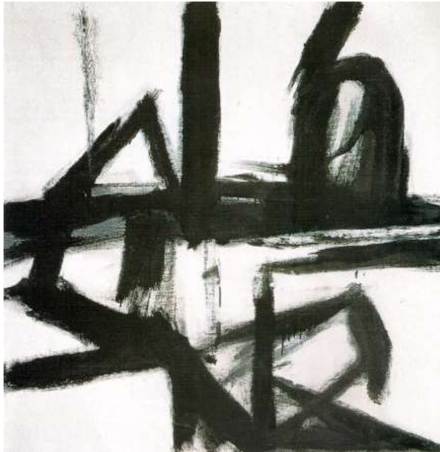
Franz Kline. Sin título, óleo sobre lienzo, 1955.