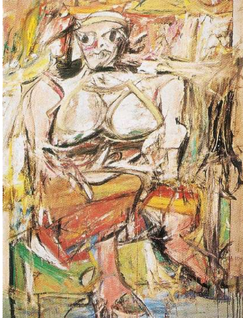
Willem de Kooning. Mujer I , óleo sobre lienzo, 1950-1952.