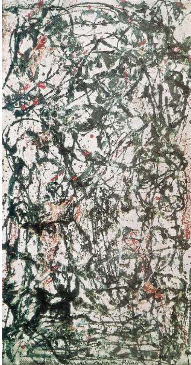
Jackson Pollock. Bosque encantado , óleo sobre lienzo, 1947.