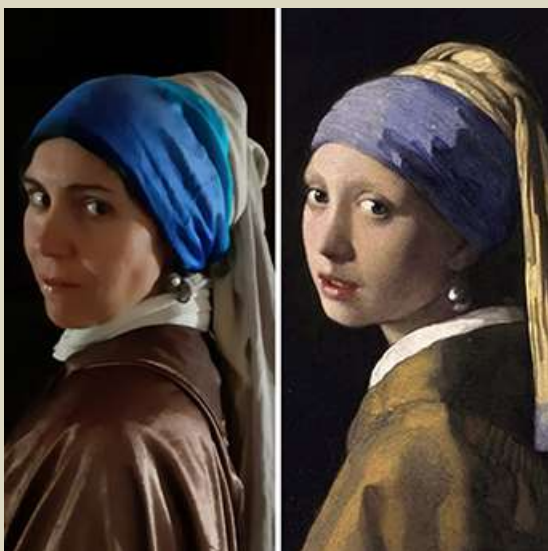
Vermeer - La joven de la perla, 1665/67