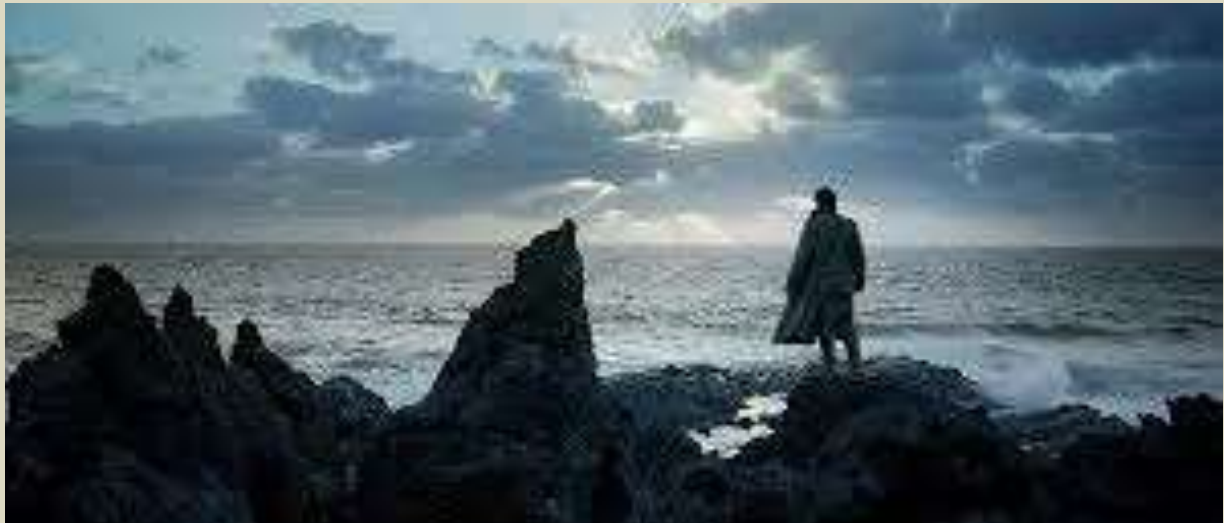
Gens - fotograma película La piel fría, 2017