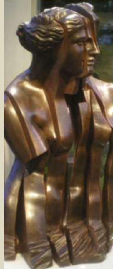
Minujín, Venus fragmentándose, 1960