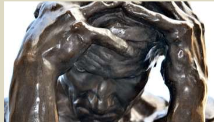
Rodin – Los burgueses de Calais (detalle), 1889