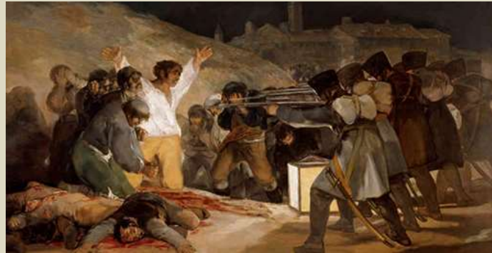
Goya – Los fusilamientos, 1814

El artista hace interpretaciones cargadas de subjetividad.