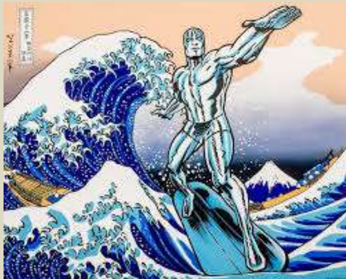
Marvel - Silver surfer