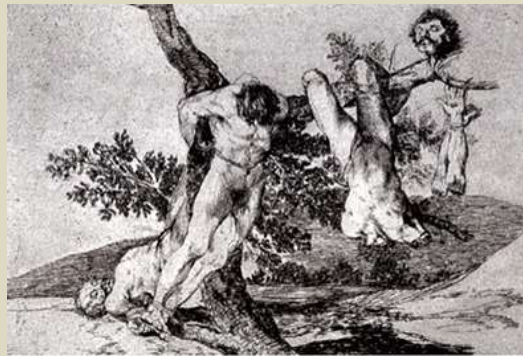
Goya – La gran hazaña contra los muertos 1

En 2003, pintaron sobre 83 obras de Goya que fueron editadas en 1937.