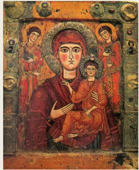
ícono de la Virgen y el Niño, s IX