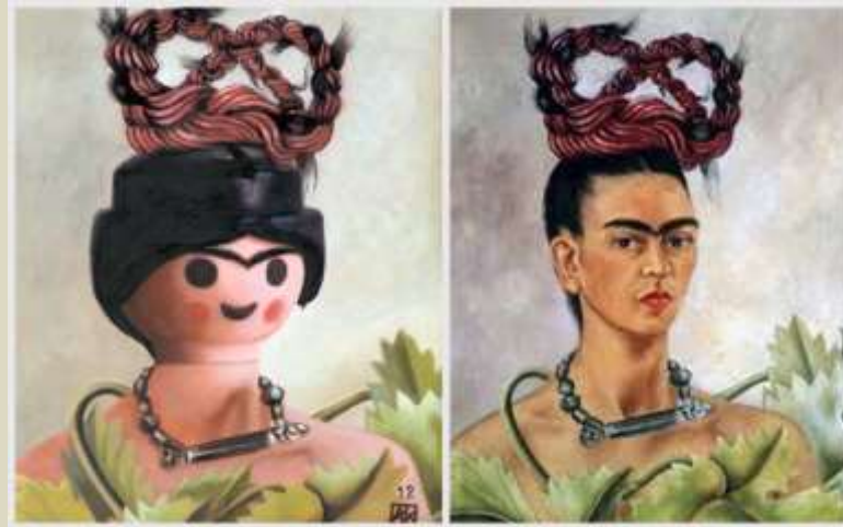
Kahlo – Autorretrato con trenza, 1941