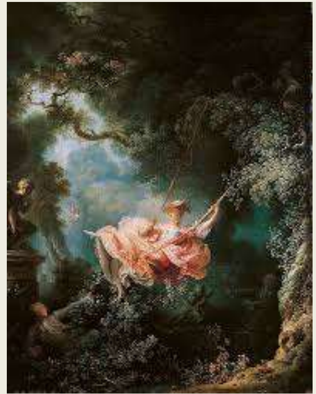
Fragonard – El columpio, 1767