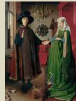
Van Eyck - Retrato matrimonio Arnolfini, 1434