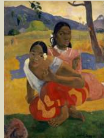
Gauguin – ¿Cuándo te casas?, 1892