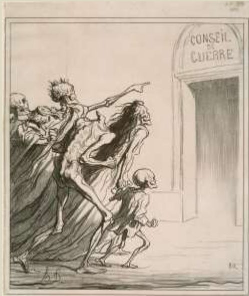
Honoré Daumier - La Silueta y Le Charivari, alrededor de 1830

Ilustradores de periódicos. Europa, siglo XIX.