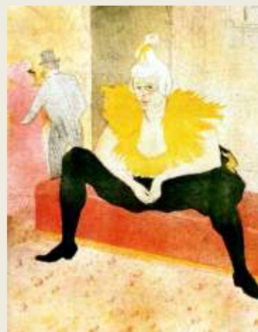
Toulouse Lautrec – Payaso sentado, señorita Cha U Kao, 1896

El museo J. Paul Getty de Los Ángeles, ha invitado a las personas, a través de Twitter, a recrear obras de arte con objetos cotidianos de sus casas.