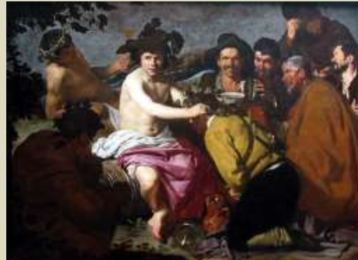
Velázquez, El Triunfo de Baco, 1629