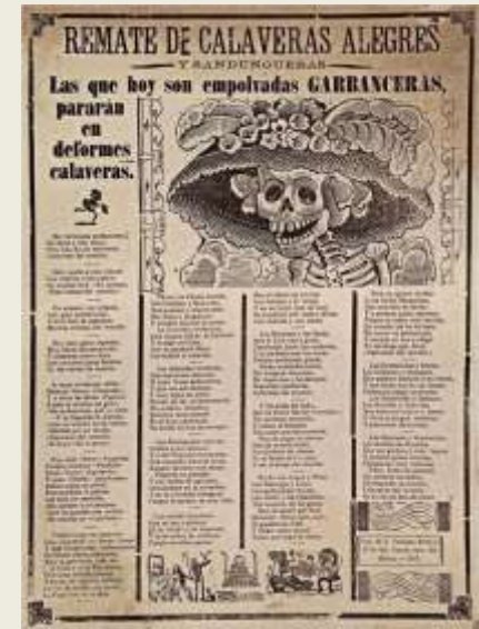
J. G. Posada – El Popular y El Chisme, alrededor de 1880