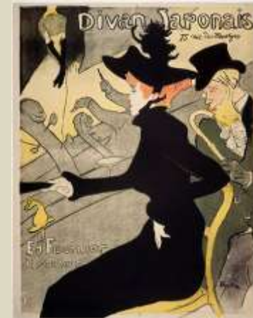
Toulouse-Lautrec – Divan Japonais, 1893