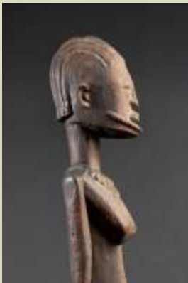
escultura africana, s XVIII