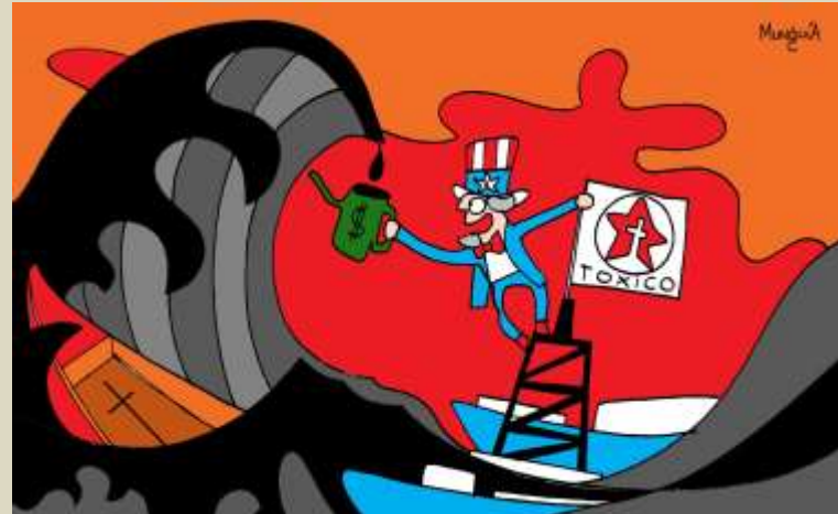
Munguía - Tsunami de petróleo, 2010