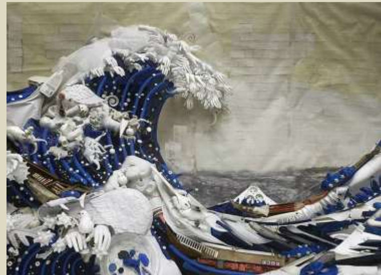
Bernard Pras - La gran ola, 2014