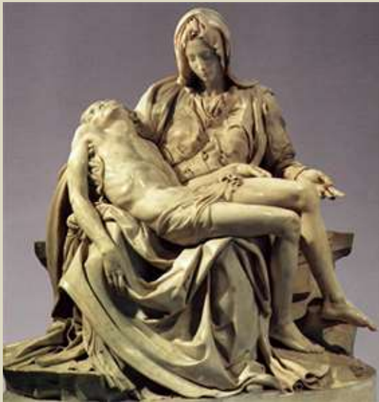
Miguel Ángel - La Piedad, 1499