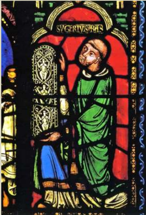
vitrales, s XII / s XIII