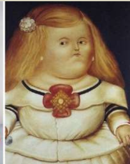
Botero - Infanta Margarita