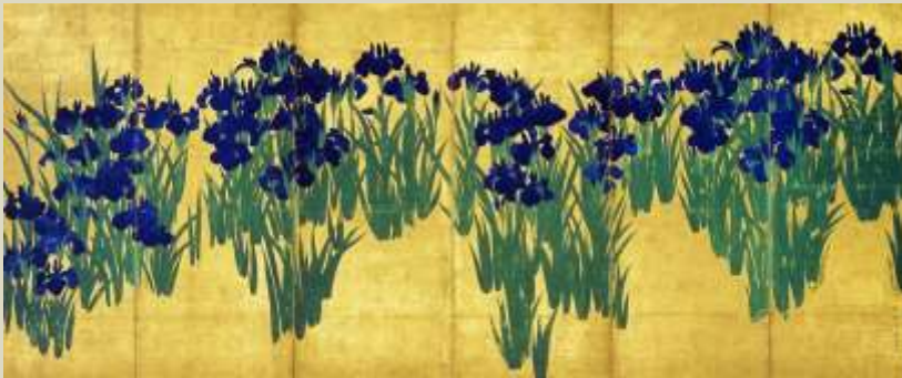
Ogata Korin – Lirios, 1705

Naturaleza, temas simbólicos y costumbristas.