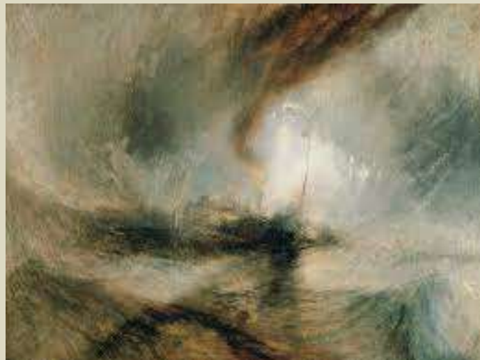
Turner – Tormenta de nieve, 1842