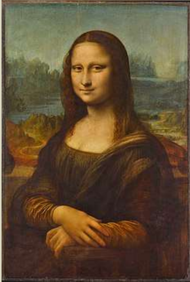
La Gioconda, Leonardo da Vinci, 1503-1519