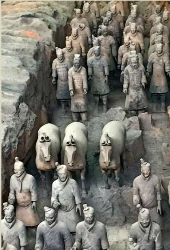
Guerreros de terracota, 210-209 a. C.