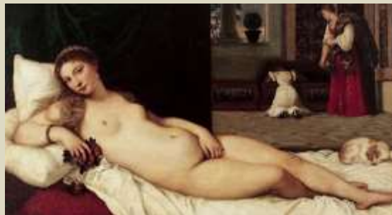
Tiziano – Venus de Urbino, 1538.