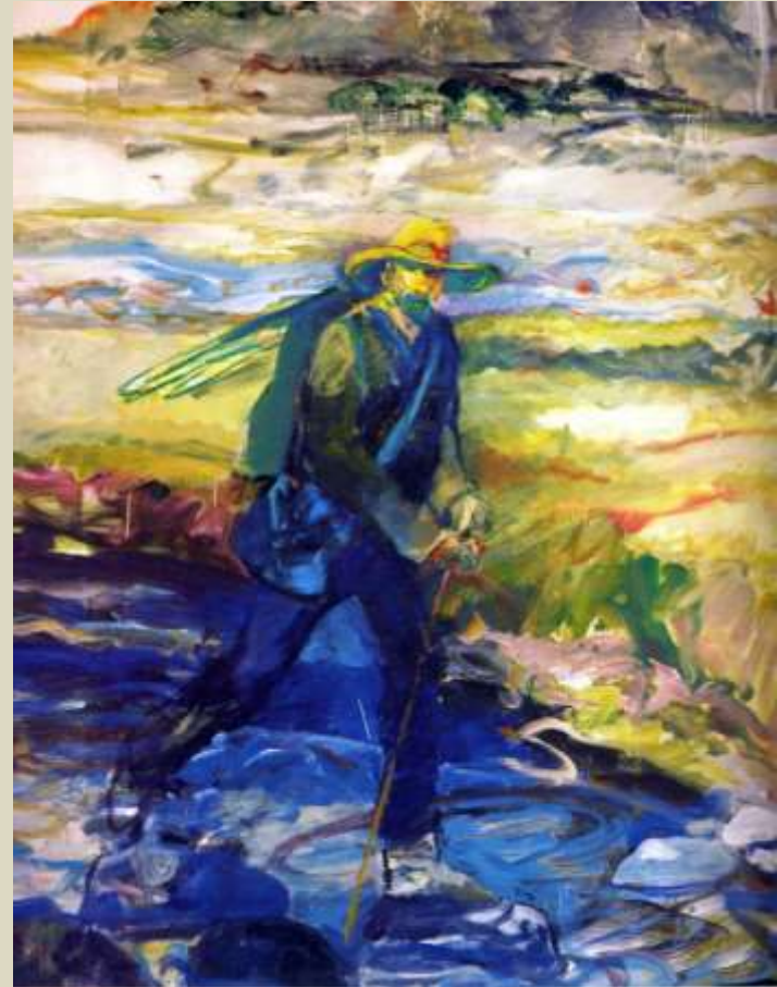
Alonso – Serie: El pintor caminante, 1990