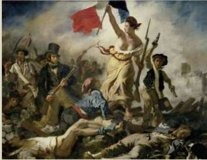
Delacroix - La Libertad guiando al pueblo, 1830