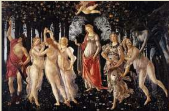
Botticelli - Primavera, 1477-1482

Temas mitológicos, religiosos, escenas costumbristas, desnudos, retratos, autorretratos.