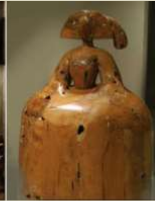
Saló i Primavera, 2014