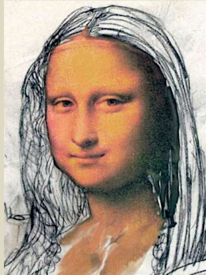
El Arte en el cómic, 2016