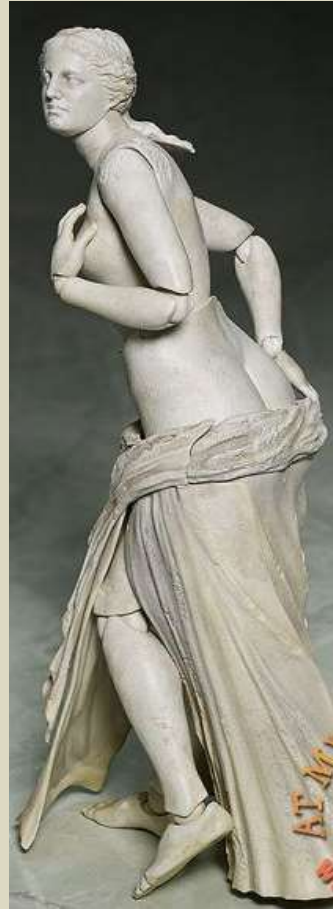
Muñeca articulada, juguetera japonesa Figma