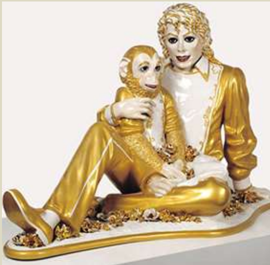
Jeff Koons - Michael Jackson and bubbles, 1988