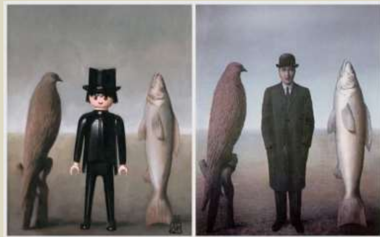
Magritte – La presencia del espíritu, 1960