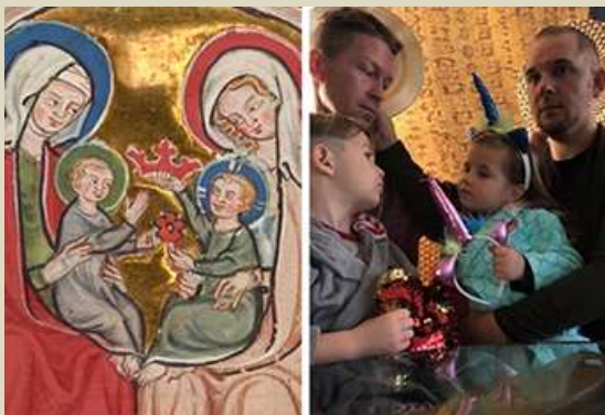
Anónimo – La Virgen, Santa Isabel, Juan Bautista y Jesús, 1300