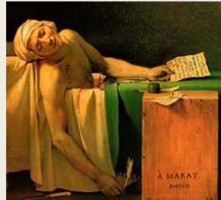
David - La muerte de Marat, 1793