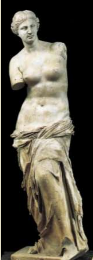
Venus de Milo 130/100 a.C .