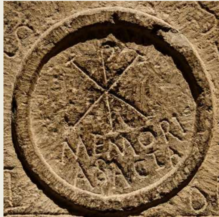
relieve paleocristiano, s I al s V

Código para reconocerse en la clandestinidad.