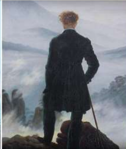
Friedrich-El Caminante sobre mar y nubes, 1818