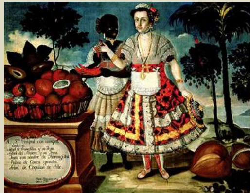
pintura quiteña (Ecuador), s XVIII