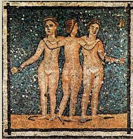
Mosaico romano, siglos III y IV