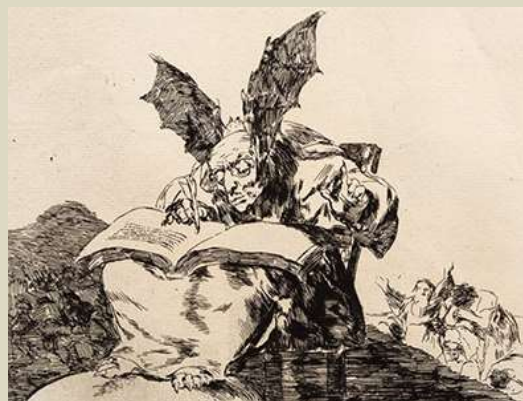
Goya – Contra el bien general, 1