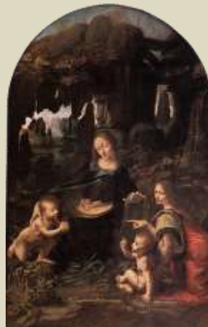
Leonardo La Virgen de las rocas, 1483