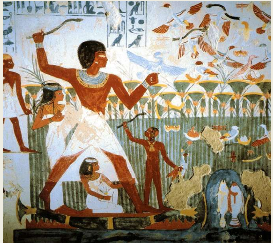
Friso egipcio, 1550 – 1070 a.C.

En relación a lo simbólico, religioso y funerario.