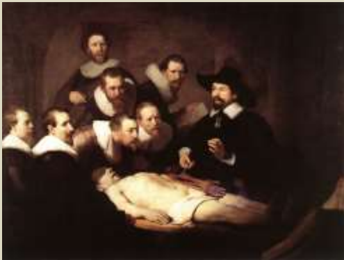
Rembrandt - La lección de anatomía, 1632