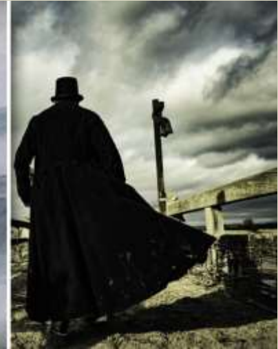
Knight - fotograma serie Taboo, 2017