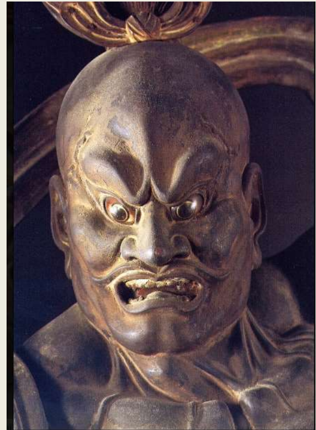
detalle guardián budista, s XIII