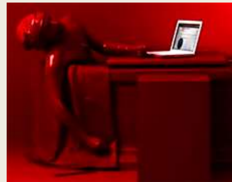
Richard Jackson - Cuarto de lavado, 2007