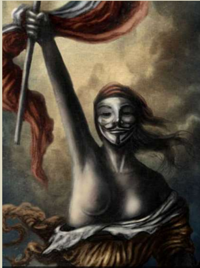
El Arte en el cómic, 2016