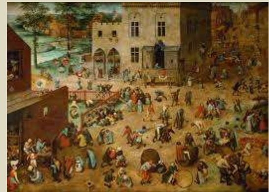
Brueghel - Juegos infantiles, 1560