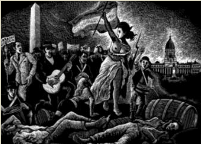
Delgadp – Fervor popular, 2014