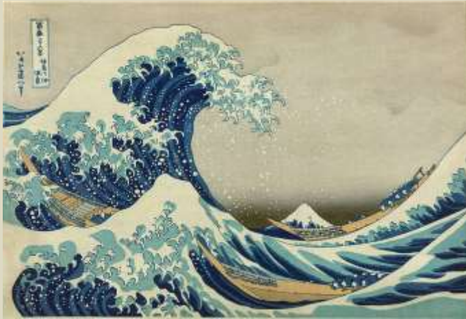
Hokusai - La gran ola Kanagawa, 1830