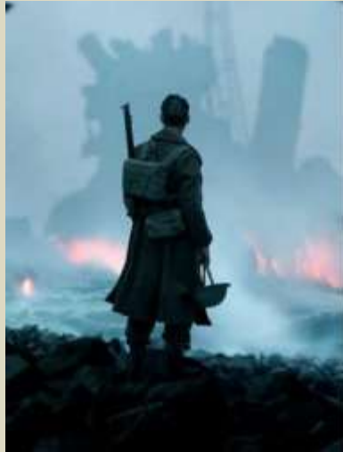
Nolan - fotograma película Dunquerque, 2017