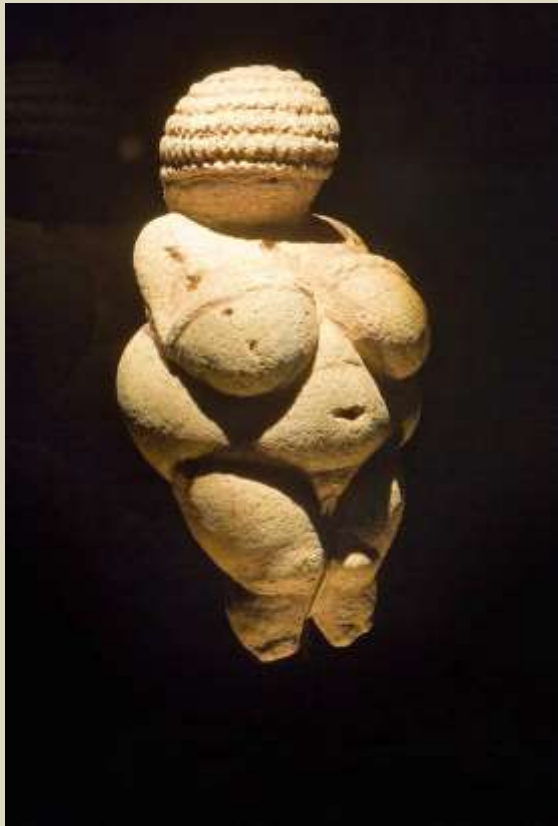
Venus de Willendorf, 25.000 a.C.