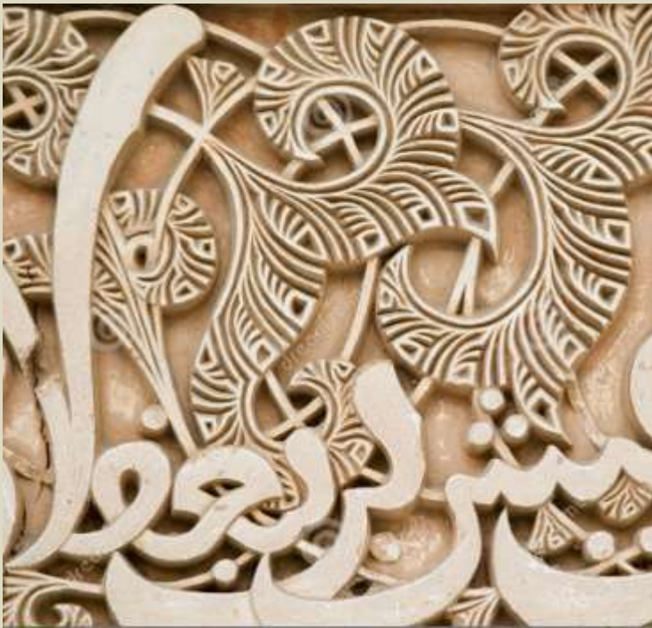
relieve arte mudéjar, s IX

Vegetales combinados con fragmentos del Corán.