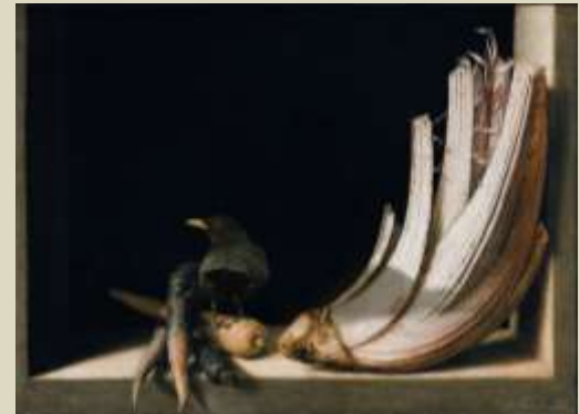
Sánchez Cotán - Bodegón con cardo, 1602