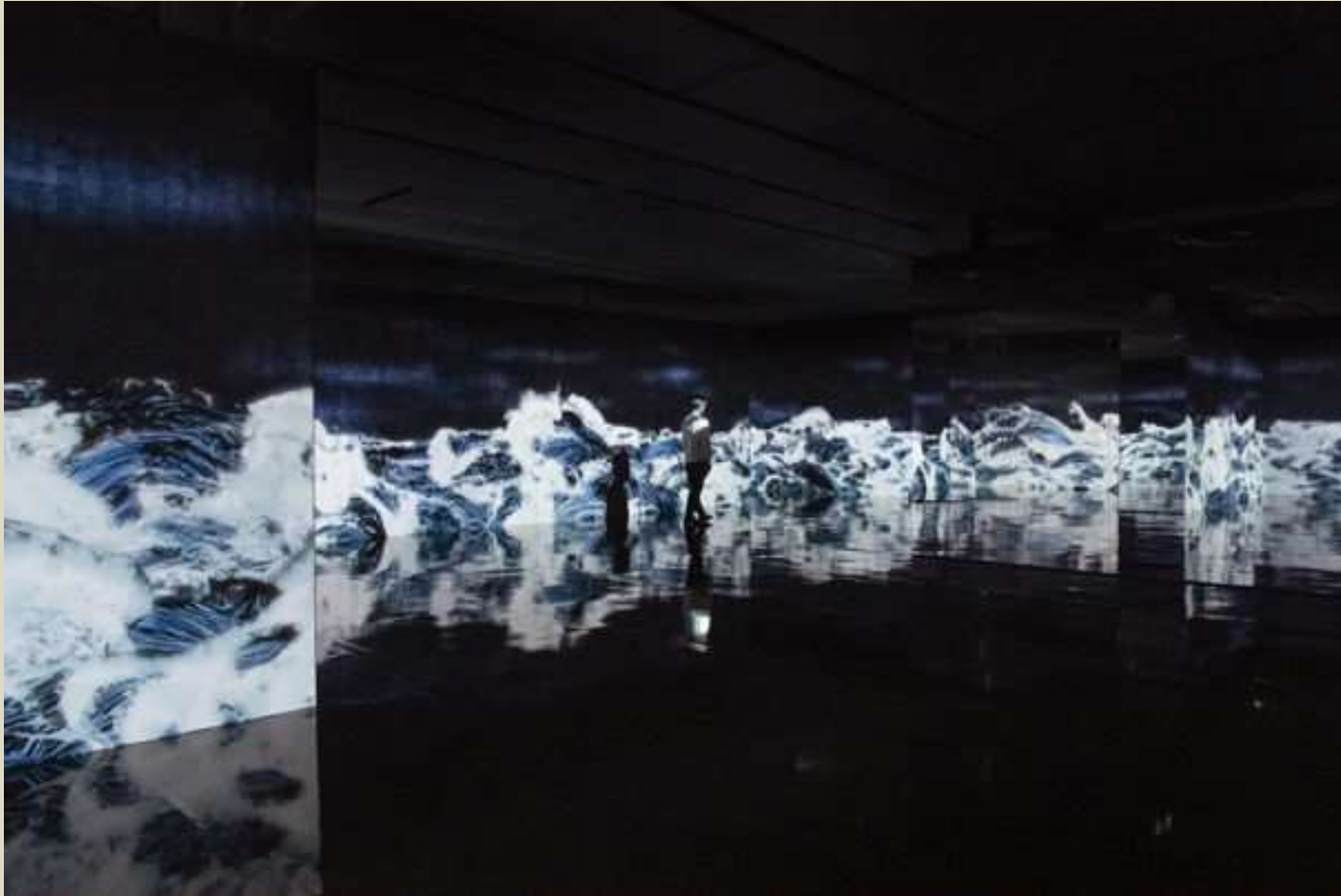
Colectivo de arte digital Teamlab, Black Waves: Lost, Immersed and Reborn, 2019