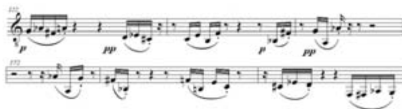
Ejemplo 5: Humpty Dumpty , Marta Lambertini. Cc. 122-124 y Cc. 174-172

Otro ejemplo puede encontrarse en la comparación de los dos fragmentos del Ejemplo 5: