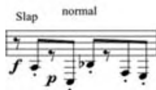
Ejemplo 7: Humpty Dumpty , Marta Lambertini C. 2