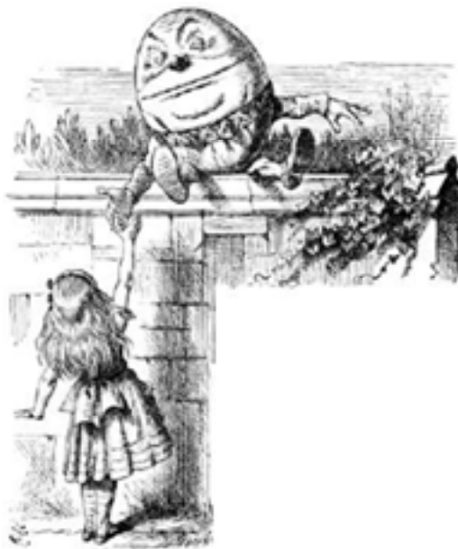
Ilustración original incluida en A través del espejo... por John Tenniel

visto como un huevo antropomórfico, vestido con traje y de un gran tamaño, bastante torpe y algo soberbio.