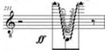
Ejemplo 14: Humpty Dumpty , Marta Lambertini C. 211