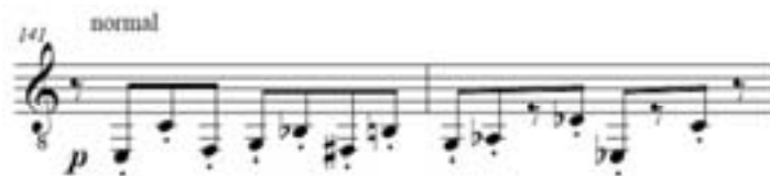
Ejemplo 4: Humpty Dumpty , Marta Lambertini. Cc. 141-142

En el Ejemplo 4 se da una retrogradación de los compases 1 y 2. Pero no es una retrogradación exacta en ningún sentido. Este fragmento se presenta a una cuarta aumentada del inicial (en Lab en vez de Mi).