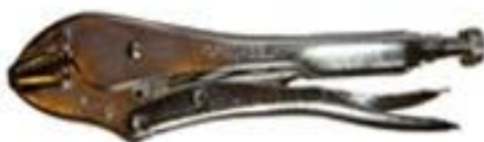
Alicate de Presión