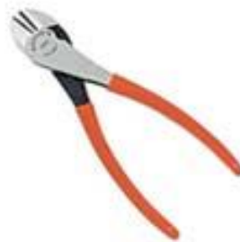
Alicate de Corte