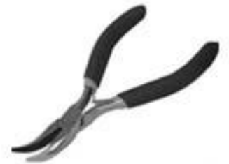
Alicate Punta de Loro