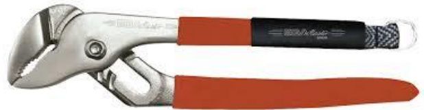
PINZAS PICO DE LORO