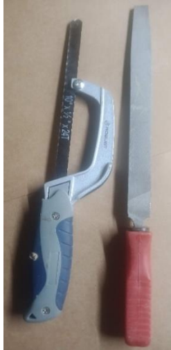
SIERRA – LIMA