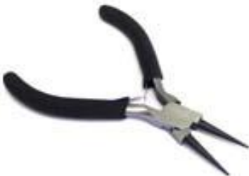
Alicate Punta Redonda