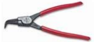
Alicate para Seagers